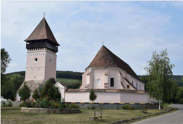
Biserica fortificată din Seleş (jud. Mureș)