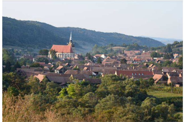
Localitatea Saschiz (jud. Mureș) cu biserica fortificată monument UNESCO