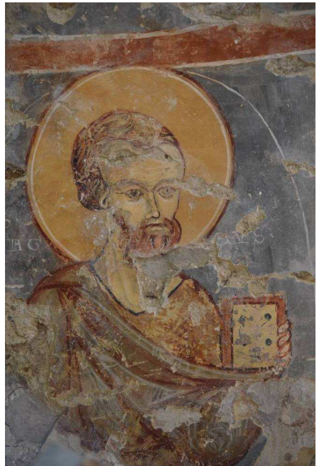
Biserica evanghelică din Bunești (jud. Brașov). Apostolul Matei