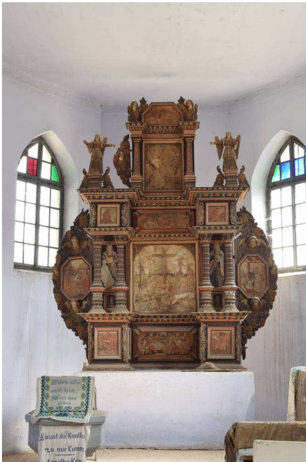
Retablul din Boarta (jud. Sibiu).