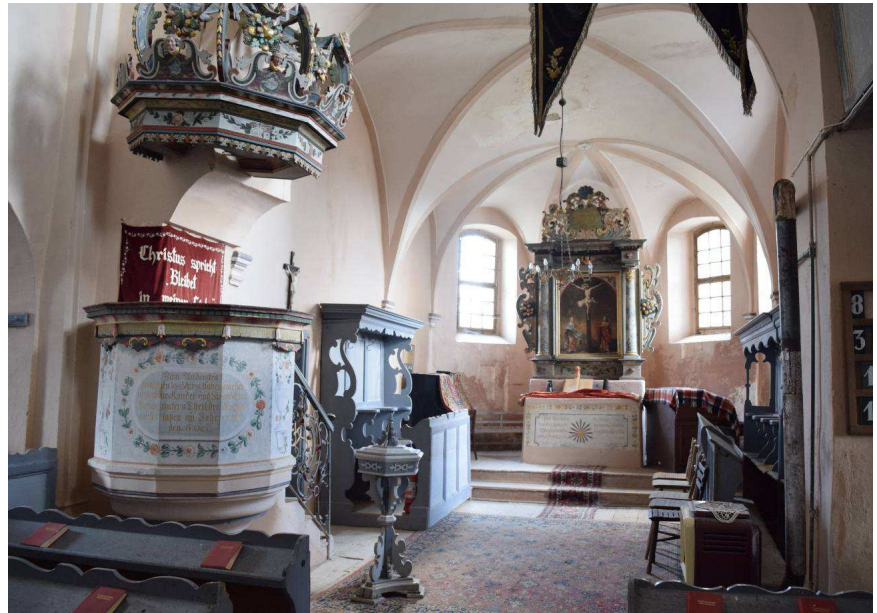
Biserica evanghelică din Daia (jud. Sibiu). Interior