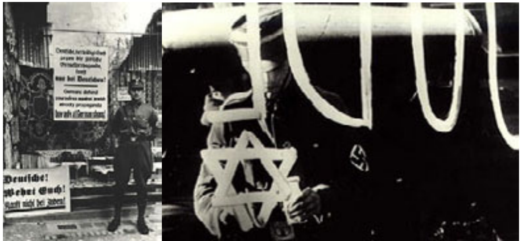
Campania de boicotare a afacerilor evreiești.

Politica antisemită a regimului nazist începe încă din aprilie 1933 când la ordinul lui Goebbels se declanșează o campanie de boicotare a magazinelor evreiești și violențele sunt momentan oprite numai de o opoziție aproape generalizată. Totuși, în aceeași lună începe excluderea non-arienilor din funcțiile publice, apoi din Universitate, din profesii liberale, din viața culturală. În septembrie 1933 își pierd licența de funcționare 3.000 de doctori, 4.000 de avocați, 2.000 de artiști evrei.