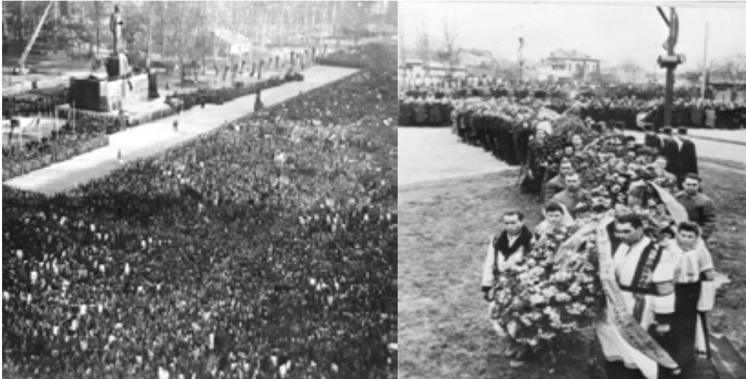
Ceremonii de doliu la moartea lui Stalin în Ungaria și România