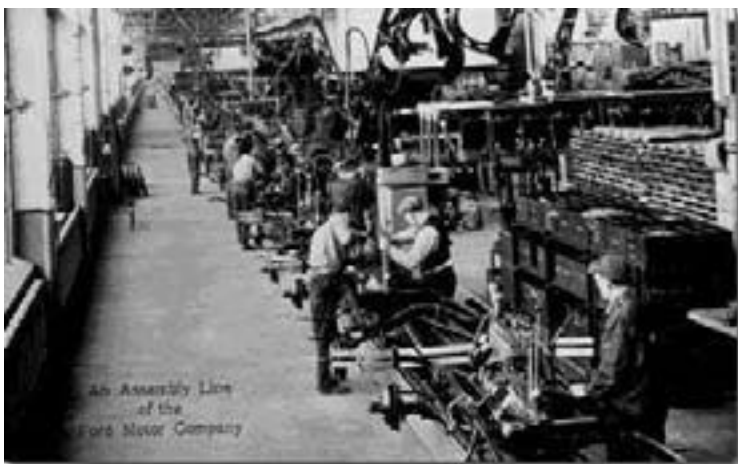
Linie de asamblare la uzinele Ford