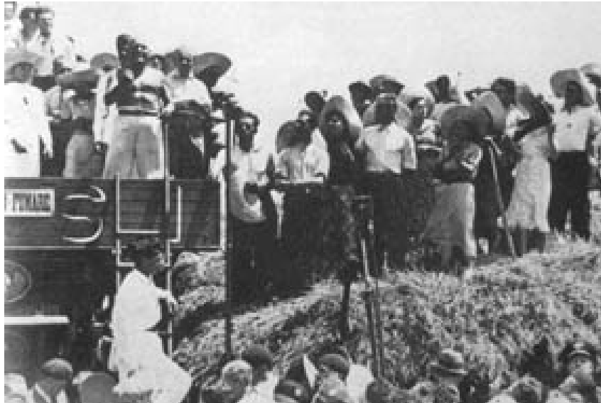
Mussolini în timpul “bătăliei grâului”, fără cămașă, între muncitorii agricoli.

integrale (1920) pune în valoare terenuri necultivate și 5 milioane de hectare sunt reamenajate și reintroduse în circuitul agricol. Succesul cel mai puternic mediatizat este asanarea mlaștinilor pontine unde sunt instalate mii de exploatari agricole și edificate localități agrare noi (Littoria, Pontinia). Practic, în 1933 producția agricolă este dublă față de 1925 (de la 5 milioane tone la 8,5 milioane) și Italia poate renunța la importurile de cereale care dezechilibrău puternic balanța comercială.