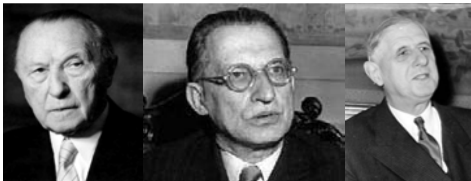
Trei dintre conducătorii Europei Occidentale după al doilea război mondial: germanul Konrad Adenauer (1876-1967), italianul De Gasperi (1881-1954) și francezul De Gaulle (1890-1970)

În cazul primelor trei decenii postbelice se poate vorbi de o preponderență conservatoare în Vestul Europei. În Germania Occidentală (RFG) creștin-democrații conduși de K. Adenauer au guvernat singuri sau în coaliție de la crearea statului până în 1969, în Italia tot creștin-democrații – conduși de De Gasperi - nu au lipsit din nici un guvern format în Italia până în 1994. În Marea Britanie, între 1951 și 1964, s-au succedat la putere o serie de guverne conservatoare, dar adevăratul simbol al preponderenței menționate mai sus a fost fără îndoială venirea lui De Gaulle la putere în 1958.