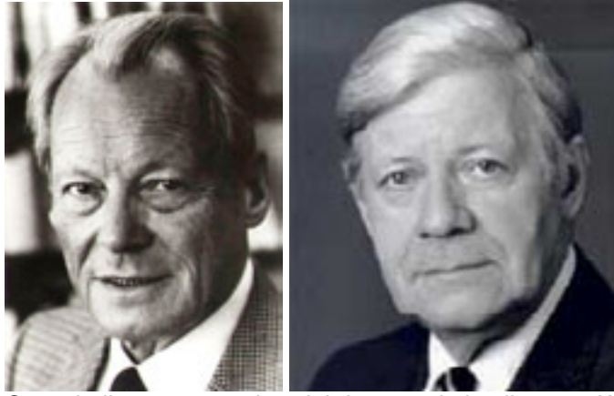
Cancelarii vest-germani social democrați ai anilor 70 – Willy Brandt și Helmut Schmidt

Italia În Italia , încă din a doua jumătate a deceniului al șaselea, Partidul Socialist s-a distanțat de comuniști, și-a revizuit atitudinea față de NATO și s-a arătat dispus să intre la guvernare alături de creștin-democrați, lucru care s-a și întâmplat în 1963.