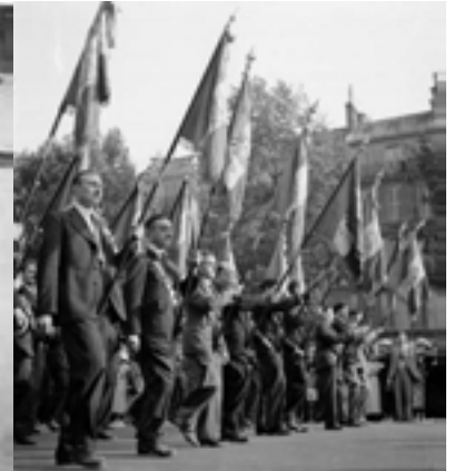
“Crucea de foc”