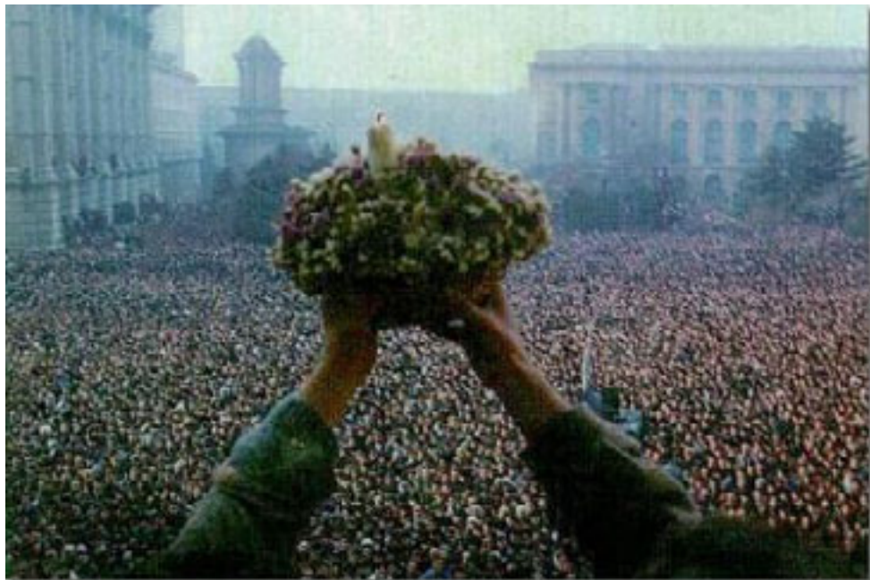
Problemele perioadei postcomuniste

Respingerea comunismului ca regim politic și afirmarea independenței statelor din Estul Europei nu a însemnat, din păcate, și eliminarea moștenirii acestuia. O cultură politică de a o anumită factură fusese internalizată de societățile supuse deceniilor de totalitarism: absența unei culturi a compromisului, neîncrederea în instituțiile statului, dar și un anumit model de raportare a acestor instituții la societate.