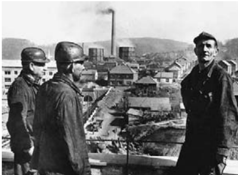
Komlo, Ungaria – un sat transformat în „oraș” al minerilor

Industrializarea forțată și colectivizarea au avut printre consecințe și modificarea dramatică a structurii societăților est-europene. Ponderea agriculturii și a populației rurale a început să scadă, procesul de urbanizare fiind accelerat. Pentru a asigura creșterea economică rapidă nu erau, însă suficiente, doar planificarea și o redirecționare a resurselor spre anumite sectoare. Era vizată, în egală măsură, crearea unei noi etici a muncii: modelul era furnizat din nou de Uniunea Sovietică a anilor '30, „stahanovismul” fiind cuvântul de ordine.