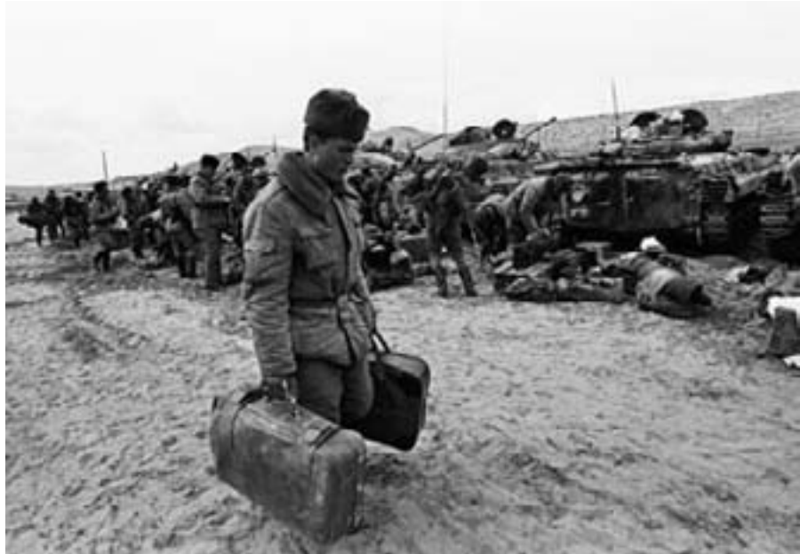
Soldați sovietici în Afghanistan pregătindu-se de retragere – februarie 1989

În plan extern, deși a reușit o spectaculoasă apropiere de statele occidentale Gorbaciov a rezolvat la fel de ezitant problema retragerii trupelor sovietice din Afganistan iar conflictul din Asia Centrală a oferit prilejul unora dintre primele manifestări ale societății civile în Uniunea Sovietică. Pierderile umane masive - între 15.000 (cifrele oficiale sovietice) și 50.000 - au creat încă o sursă de tensiune între regim și societate iar mobilizarea forțată a naționalităților a produs noi linii de fractură în interiorul sistemului.