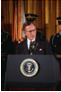
George HW Bush

Noul candidat republican la alegerile din 1988, George H.W. Bush, a profitat exact de această ameliorare a situației economice. Campania electorală a fost bazată masiv pe televiziune și a avut un puternic caracter negativ, context în care democrații nu au putut pune în discuție moștenirea lăsată de Reagan. Alegerile au confirmat bascularea completă a Sudului spre republicani, iar votul a fost puternic marcat de factorul rasial: votul republican a fost aproape exclusiv alb, în timp ce majoritatea comunității de culoare a votat pentru democrați. Bush a câștigat cu 53% din voturi, dar prezența la vot a fost de numai 50%.