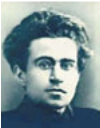
Antonio Gramsci 1891-1937

Încă de la începutul secolului o fracțiune din mica burghezie abandonată la periferia vieții politice, găsindu-și cu greu locul în evoluția industrială va fi câștigată de ideile anticapitaliste și antiparlamentare în timp ce proletariatul industrial de dată recentă este adeptul unui anarho-sindicalism juxtapus tezelor marxiste. Partidul Socialist, activ dar puțin numeros înainte de război va înregistra progrese rapide (1914 - 50.000, 1920 - peste 300.000 de membrii) și va domina stânga politică și cele mai importante centrale sindicale – Confederația Generală a Muncitorilor Italiani și Federația Muncitorilor Agricoli. La sfârșitul primului război mondial socialiștii se vor diviza între o minoritate reformistă (lider - Turatti) și o majoritate maximalistă (Serrati, Bordiga) ce susține tezele leniniste privind necesitatea cuceririi puterii de către proletariat. În 1921 se adaugă gruparea lui Gramsci și Togliatti, desprinsă din aripa maximalistă, ce fondează Partidul Comunist Italian, intrând în Internaționala a treia.