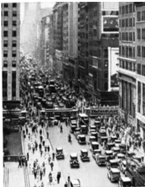
New York – Trafic

Urbanizarea accentuată (în 1930 - 56% din populația americană) a fost însoțită de modificarea peisajului urban: cartiere specializate de afaceri invadate de zgârie-nori, mahalale sordide dominate de imigranții recentți, periferii rezidențiale unite cu centrul de mijloace de transport rapide pentru majoritatea clasei de mijloc.