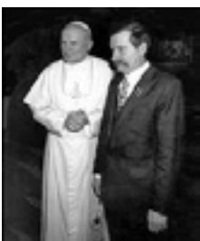
Papa Ioan Paul al II-lea și Lech Walesa

Societatea poloneză, care primise în 1978 un puternic impuls prin alegerea unui Papă din rândurile ei, și-a găsit astfel o modalitate de exprimare politică. 1980 și 1981 au fost doi ani critici, doi ani în care autoritatea partidului s-a erodat și mai mult, iar asupra Poloniei a planat amenințarea unei intervenții militare sovietice.