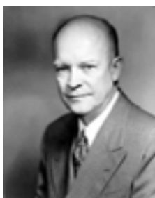
Dwight D. Eisenhower