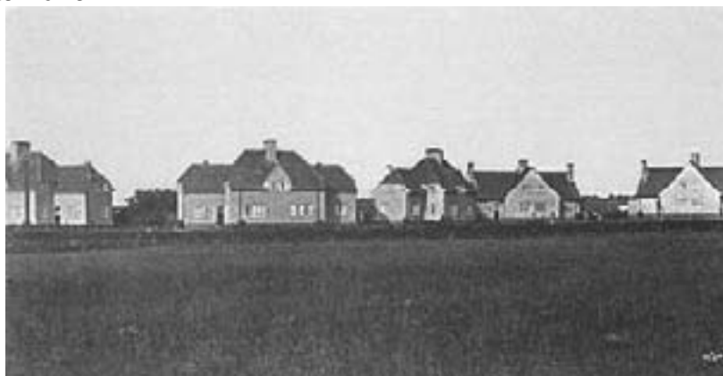
Cartier de locuințe sociale

În plus, această clasă mijlocie dobândește acces la confort și loisir grație creditelor și progresului înregistrat de magazinele cu distribuție de masă (Woolworth), iar din 1924, Housing Act – o lege a caselor – introduce un vast program de locuințe sociale pentru rezolvarea problemelor ridicate de cazare. Practic în 1939, aproape fiecare cămin burghez dispune de un grad ridicat de confort casnic (automobil, bunuri de consum variate) și de concediu plătit de cel puțin o săptămână.