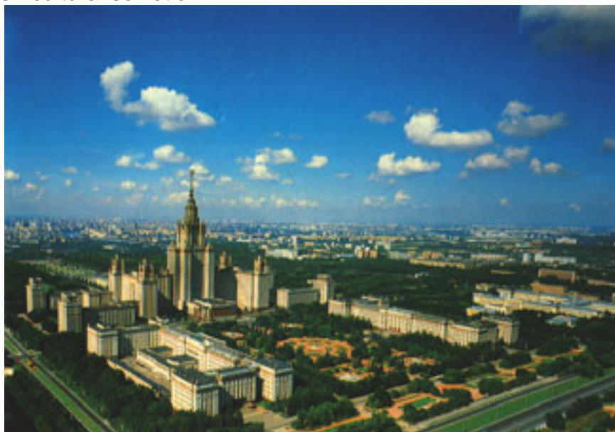
Exemplu de arhitectură monumentală din era stalinistă – Universitatea de stat Lomonosov din Moscova

Cultura Cultura sovietică, impregnată de propagandă și autorizată de stat începea a se naște. O cultură proletară în care realismul socialist era doctrina oficială, în care cinematograful ia avânt dar în care nu își mai găsesc locul scriitorii și poeții importanți precum Pasternak, Bulgakov sau Maiakovski. Arhitectura monumentală, recuperarea artei populare și a trecutului istoric mitizat pot fi considerate elementele de bază ale noului fenomen cultural sovietic.