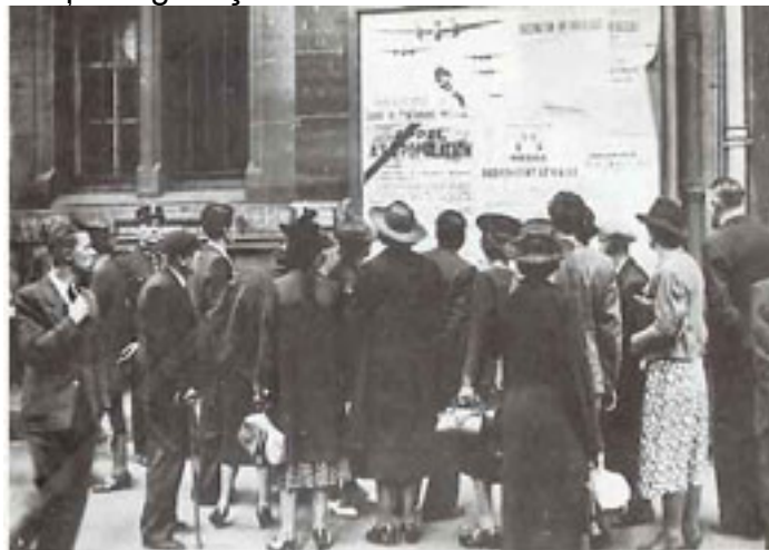
1 sept.1939 – ordinul de mobilizare generală

Problemele interne sunt însă cu adevărat depășite datorită evenimentelor internaționale. La 1 septembrie 1939 Hitler atacă Polonia și două zile mai târziu, după expirarea ultimatumului acordat de puterile occidentale, Franța se găsește în stare de război cu Germania nazistă.