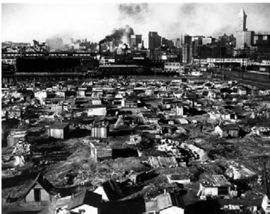
Hooverville – Seattle, 1933

Circulația monetară se prăbușește, contractându-se cu 31% față de 1931, ceea ce forțază guvernul federal să pompeze lichidități în economie pentru a evita o prăbușire totală a circulației monetare și deci a prețurilor și consumului. Președintele Hoover a refuzat însă introducerea alocației de șomaj și condițiile de viață ale șomerilor s-au înrăutățit: au apărut "orașele Hoover" (Hoovervilles), cartiere improvizate unde criminalitatea și vagabondajul au crescut, s-a diminuat numărul de căsătorii și natalitatea.