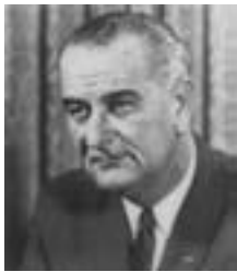
Lyndon B. Johnson

Asasinarea președintelui în noiembrie 1963 a șocat America, dar acest moment de tragedie națională a unificat societatea și succesorul său, Lyndon B. Johnson, a reușit să treacă prin Congres practic întreaga legislație necesară Noii Frontiere. Imediat după moartea lui Kennedy, Johnson a promis continuitate, a promis ducerea la bun sfârșit a programului președintelui martir. Dar avea planuri mai ambițioase și intenționa să îndeplinească și toate obiectivele nerealizate ale administrațiilor Roosevelt și Truman. Noul său program a fost intitulat Marea Societate.