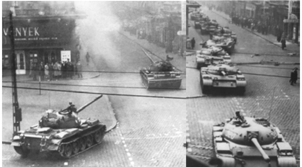
Tancuri sovietice în Budapesta – noiembrie 1956

să accepte și a pecetluit soarta revoluției maghiare când a anunțat părăsirea Pactului de la Varșovia de către Ungaria și a cerut plecarea trupelor sovietice. Pe 4 noiembrie 6000 de tancuri sovietice au intrat în Ungaria, iar în capitală luptele au continuat până pe 12 noiembrie.