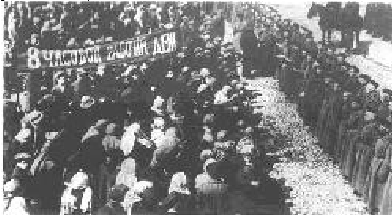
Manifestația din 25 februarie

La mijlocul lunii februarie, datorită unor dificultăți de aprovizionare, uzinele Putilov din Petrograd se închid și mii de muncitori se află practic în stradă. Pe 23 februarie, tot în acest oraș, are loc o manifestație de proporții, pașnică însă, principala revendicări fiind legate de îmbunătățirea condițiilor de viață și muncă. O zi mai târziu însă, în momentul în care majoritatea uzinelor din Petrograd au intrat în grevă generală, manifestațiile s-au radicalizat și revendicările devin politice: pace și sfârșitul autocrației.