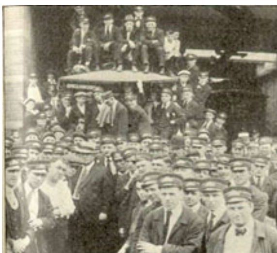
Greva în transportul comun din Chicago - 1919

Criza este însoțită de agitație socială și în 1919 au fost 2665 greve cu peste 4 milioane de muncitori implicați. Revendicările sociale au produs însă reacția celorlalte categorii sociale și conduc la apariția unui val antibolșevic („Red Scare” – Frica Roșie) în care se implică Procurorul General al SUA, A. Mitchell Palmer precum și guvernatorii unor state (New York, Massachussets) care solicită pedepse mari pentru simpla apartenență la Partidul Socialist (periferic pe scena politică americană cu doar 100.000 de membrii și susținători).