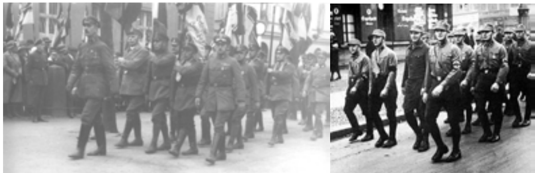
Grupări paramilitare: Stahlhelm (stânga) și Secțiile de Asalt naziste (dreapta)