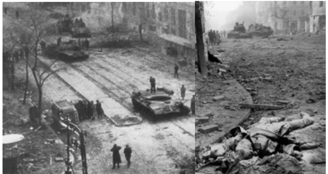
Urmările luptelor de stradă dintre trupele sovietice și insurgenți.