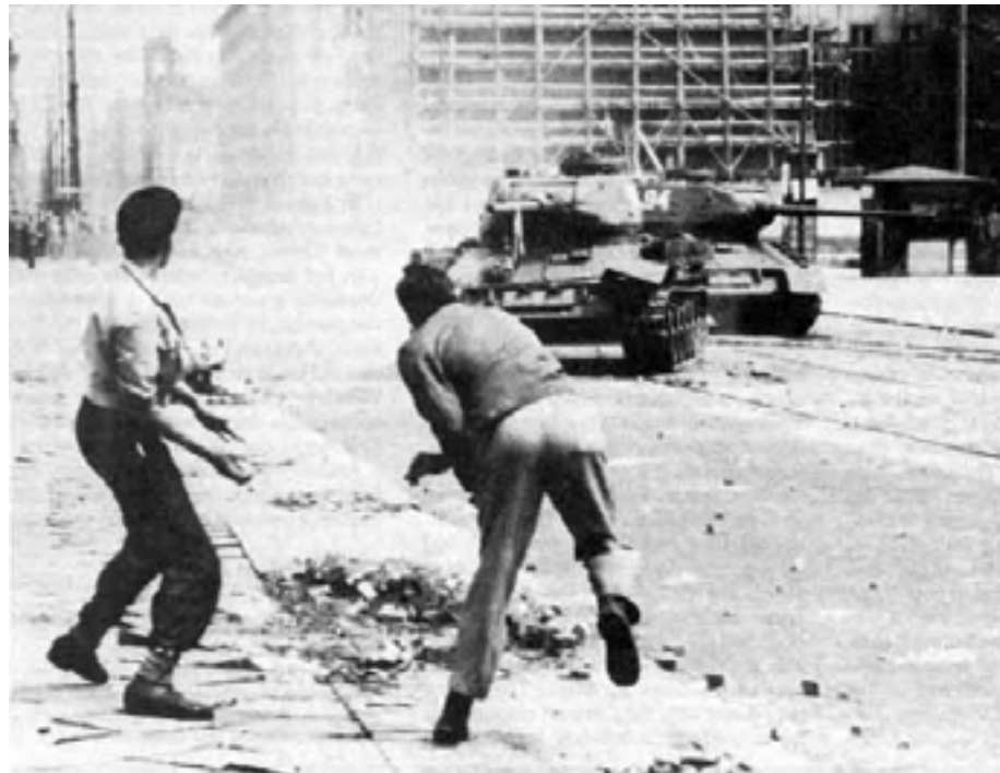
Revoltele din Berlinul de Est -1953.

Efectele crizei de succesiune Criza de succesiune din Uniunea Sovietică (1953-1956) și confuzia pe care aceasta a generat-o la nivelul conducerii sovietice au oferit șansa unei reșezări în interiorul grupurilor aflate la putere în statele satelit. Primele semne de relaxare controlată au dat naștere și primei crize: revoltele din Berlinul de Est, iunie 1953.