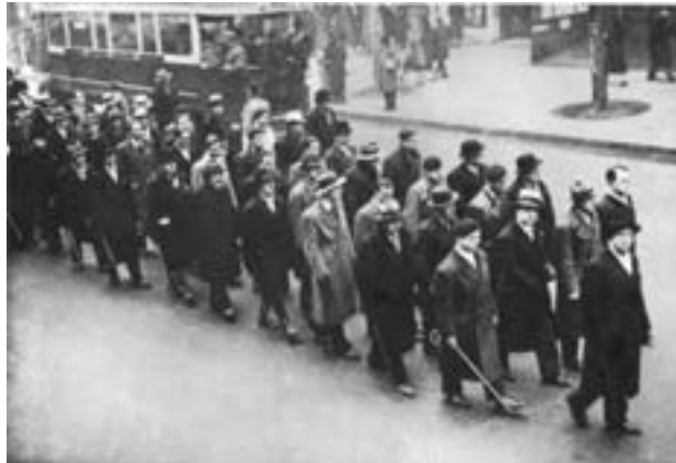
“Le camelots du roi”