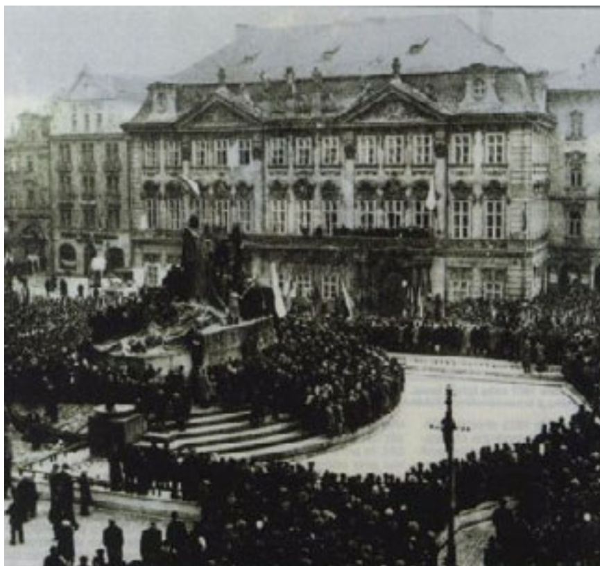
Reacția populară la lovitură de stat de la Praga (1948) – protest în fața statuii lui Jan Hus. În final poliția controlată de comuniști va interveni violent.