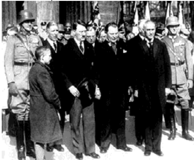
Ianuarie 1933 – instalarea cabinetului Hitler

În fața refuzului președintelui și incapabil să rezolve criza economică și să readucă stabilitatea într-o Germanie răvășită de violențe stradale cotidiene, von Papen demisionează în decembrie 1932. Succesorul său, generalul Schleicher, vrea să zdrobească atât comunismul cât și nazismul prin instaurarea unei dictaturi corporatiste după model italian. Prin programul său de reforme sociale atrage antipatia capitalismului german ce se apropie tot mai mult de Hitler și exercită o presiune crescândă asupra președintelui Hindenburg pentru a-l numi pe conducătorului național-socialist în funcția de cancelar. În ianuarie 1933 eșecul cabinetului Schleicher este evident și Hindenburg îl investește pe Adolf Hitler în funcția de Cancelar al Reich-ului.