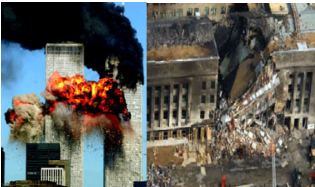
11 septembrie 2001 - Atacurile teroriste de la World Trade Center și Pentagon

La începutul noului mileniu, Statele Unite rămân principala putere militară, economică și politică a lumii, însă o radiografie sumară a realităților americane astăzi prezintă indiciile unor fisuri societale potențial periculoase. Creșterea economică a ultimului deceniu a fost în mare parte anulată, costurile războaielor din Afganistan și Irak au îngreunat bugetul federal, confruntarea politică dintre cele două partide au divizat țara mai mult ca oricând, iar pe plan extern politica Statelor Unite este puternic contestată.