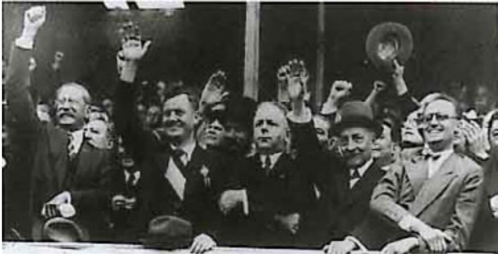
1936, victoria Frontului Popular – de la stânga la dreapta Léon Blum, Maurice Thorez secretarul Partidului Comunist Francez, Roger Salengro, ministre de interne.