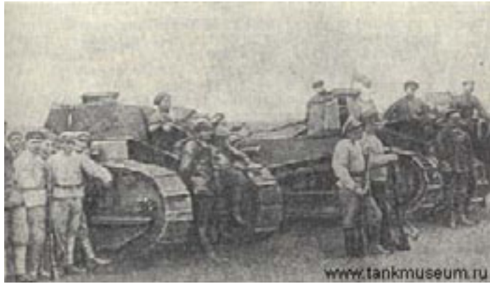
Tancuri britanice alături de armata „albă” a lui Denikin în 1918