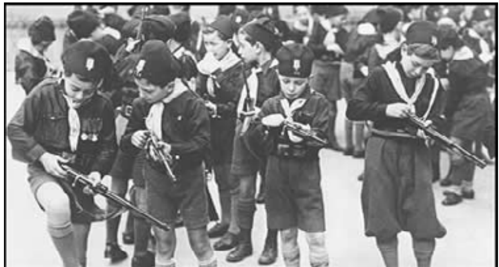
Copii din organizația fascistă Ballila

Odată adult, italianul se afla în continuare sub controlul statului. Aproape omniprezente, organele de represiune ale statului (poliția politică) eradicau orice formă de critică. Profesiunile liberale erau supravegheate prin intermediul “ordinelor” (asociațiilor) profesionale la care adeziunea era obligatorie. Clasa muncitoare a fost organizată în