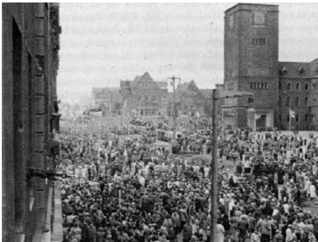
Revoltele de la Poznan, Polonia, 1956 – intervenția în forță a autorităților a dus la 67 de morți și peste 600 de răniți.

Spre deosebire de Nagy în Ungaria, Gomulka era o persoană în care sovieticii aveau încredere și atâta vreme cât partidul unic și relația URSS - Polonia nu erau puse în discuție, restul era negociabil. Astfel, Gomulka a putut impune drept condiții ale revenirii sale decolectivizarea agriculturii, eliminarea controlului sovietic asupra armatei poloneze și găsirea unei modalități de rezolvare a conflictului cu Biserica Catolică.