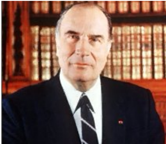
Francois Mitterand, președintele socialist al Franței între 1981 și 1995