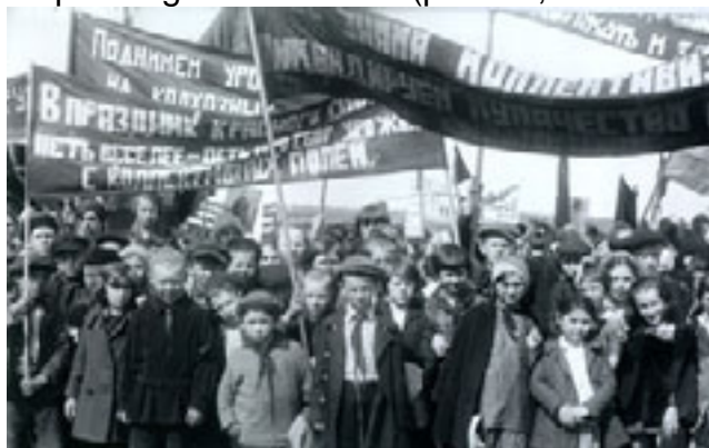
Demonstrație a pionierilor pentru colectivizare. Unul dintre slogane este „Vom crește recolta kolhozului”

„Bătălia” instruirii Statul sovietic stalinist se angajase într-o uriașă bătălie împotriva analfabetismului (peste 50% din populație în 1922, iar în Asia Centrală cifrele ajungeau la 90%) și odată cu planificarea, instruirea copiilor se accelerează. Practic în 1939 toți copiii până la 14 ani aveau cel puțin o educație elementară, existau 811.000 de studenți, peste 1 milion de învățători iar analfabetismul dispăruse la grupa de vârstă sub 50 de ani. Campania pentru instruire a fost însoțită însă de propagandă și de înregimentarea tineretului (începând de la cea mai fragedă vârstă) în structuri tipice regimului totalitar (pionieri, comsomoliști, etc)