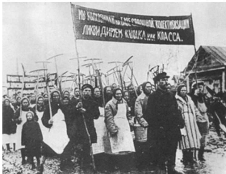
Campanie de colectivizare în anii 30. Sloganul este:” Noi kolhoznicii pentru colectivizarea completă lichidăm clasa kulacilor”

Planul a fost urmat cu promptitudine și în 1934 mai mult de 88% din terenuri erau deja integrate kolhozurilor (față de 58% în 1930). „Deculacizarea” – eliminarea clasei culacilor și cooperativizarea au atins însă și țăranii mijlocași, depășind limitele planificate și devenind un adevărat război împotriva țăranimii. Pentru a-i obliga să intre în cooperativele de producție și să-și abandoneze pământul și animalele a fost mobilizat întreg aparatul de represiune al statului, sate întregi au fost deportate și bilanțul tragic înregistrat a fost de peste 3 milioane de morți.