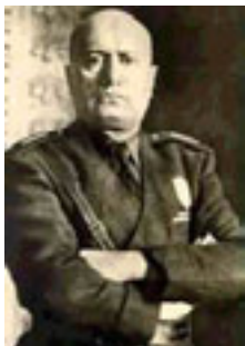
B. Mussolini 1883-1945

Mișcarea fascistă a apărut ca o expresie tipică a crizei politice și sociale existente în Italia postbelică iar traseul liderului acestei mișcări-Benito Mussolini este tipică pentru o perioadă confuză și violentă. Născut în Romagna în 1883, fiu al unui muncitor anarhist, proprietar al unui mic local, Mussolini crește într-un mediu sărac. Devine educator, pleacă în Elveția pentru a scăpa de serviciul militar, petrece scurte perioade în închisoare pentru activități subversive. Se întoarce în Italia în 1908, militează pentru socialiști iar în 1912 devine director al ziarului de stânga “Avanti” unde este campionul idei pacifiste.