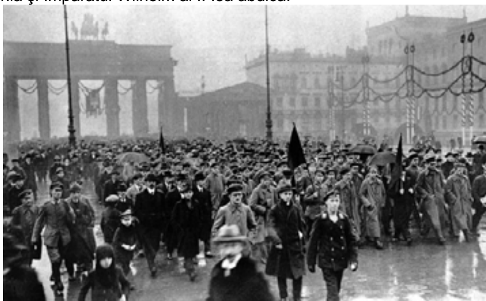
Revoluția ajunge la Berlin – 9.11.1918, demonstrații socialiști la Brandenburg Tor

Momentul este exploatat cu succes de forțele politice de stânga și pe 7 noiembrie socialistul independent Kurt Eisner proclamă în Bavaria o Republică a Sfaturilor după model sovietic. Stânga socialistă este însă divizată între majoritatea membrilor Partidului Social-Democrat German (SPD) ce solicită armistițiul, amnistierea arestaților politici și abdicarea Kaiserului și socialiștii minoritari grupați în USPD (organizația radicală Spartakus) ce propun o revoluție de tip bolșevic. Divizarea este evidentă pe 9 noiembrie atunci când revoluția ajunge la Berlin și socialistul Scheidemann proclamă Republica în timp ce spartakistul Liebknecht anunță Republica Socialistă. Practic nici o forță politică nu mai susținea monarhia și împăratul Wilhelm al II-lea abdică.