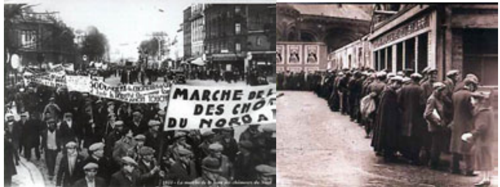
Criza economică – marșurile foamei și supa populară

Restrângerea puterii de cumpărare a agricultorilor și micșorarea exporturilor a condus la contractarea producției și șomaj (în 1933 - peste 300.000 de muncitori). Opinia publică și mediile politice au apreciat în mod greșit gravitatea crizei bazându-se pe "lecțiile" învățate în timpul crizei francului și deși guvernul lansează programe de munci publice destinate absorbirii forței de muncă aflate în șomaj (canalul alsacian, fortificațiile Maginot) efectele crizei mondiale vor fi devastatoare.