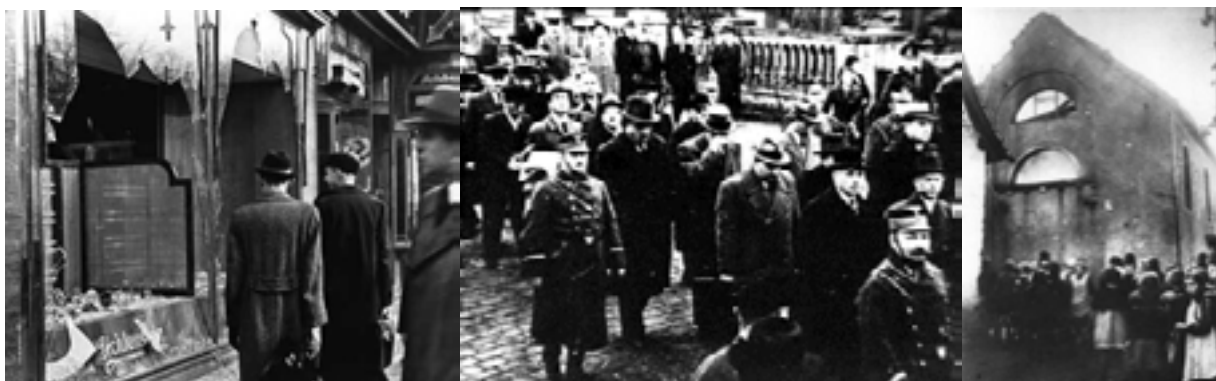
Urmările “Noptii de cristal” – magazine distruse, evrei arestați, sinagogi incendiate, 91 victime.

“Începând cu 1 ianuarie 1939 se interzice evreilor să se ocupe cu micul comerț, transporturi, agenții comerciale și de asemenea să exercite meseria de artizan independent. Dacă un evreu ocupă un post de angajat într-o întreprindere comercială el poate fi concediat cu un preaviz de șase săptămâni.” (18 noiembrie)