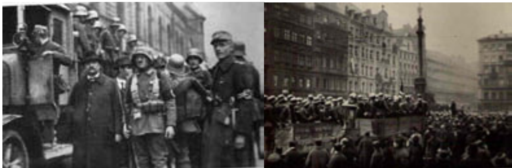
Tentativa de lovitură de stat de la München, noiembrie 1923

După ce în septembrie 1923 Hitler anunță noul program al nazismului (antimarxist, antisemit și revizionist) precum și voința sa de a doborî Republica de la Weimar, Partidul Național Socialist încearcă să dea o lovitură de stat în Bavaria. Membrii și susținătorii ai partidului contesta violent autoritatea guvernului de la Berlin și anunță instaurarea statului național-socialist. Desfășurată între 8-9 noiembrie 1923 și denumită ironic în epocă “Puciul de la berărie” (locul unde se adunau simpatizanzii NSDAP), tentativa nazistă, lipsită de un suport real din partea populației eșuează în confruntarea cu autoritățile locale iar liderii mișcării sunt arestați.