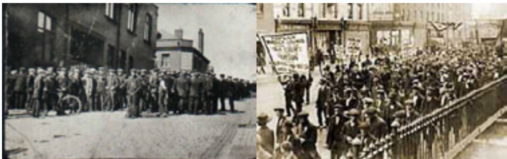
Greva generală din 1921

În același timp apare o lege (Emergency Power Act - 1920) care conferă executivului puteri excepționale în caz de tulburări sociale și conflicte de muncă. Momentul culminat al mișcărilor de protest se petrece în aprilie 1921 când, în urma tentativelor executivului de a raționaliza industria minieră și a reforma sistemul căilor ferate minerii intră în grevă generală, urmați de muncitorii din alte sectoare economice. Protestul va eșua datorită retragerii feroviarilor și a lucrătorilor din transporturi.