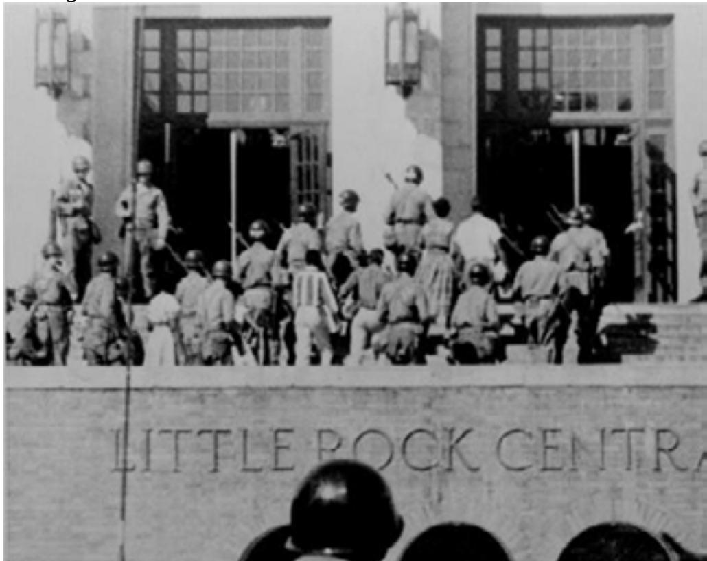
Trupele federale protejează elevii de culoare la Little Rock, în 1957

În septembrie 1957, trupele federale sunt trimise la Little Rock, în Arkansas, pentru a proteja elevii de culoare de la liceul din localitate. Anterior, în 1955, comunitatea de culoare din Montgomery, Alabama, organizase un boicot al sistemului de transport în comun și îl alesese ca lider pe pastorul baptist local, Martin Luther King Jr. Era debutul unei mișcări de protest nonviolente care avea să capete dimensiuni naționale. În 1957 Luther King devine lider al întregii mișcări a drepturilor civile din statele sudice. În același an, Congresul votează Civil Rights Act, legea ce crea o comisie federală ce trebuia să investigheze cazurile de discriminare.