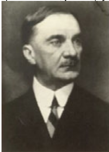
Iuliu Maniu (1873-1953) - lider al Partidului Național Țărănesc, condamnat la închisoare pe viață în 1947 de autoritățile comuniste, moare în Penitenciarul de la Sighet

Asaltul din exterior asupra partidelor democratice a luat forma așa-numitei „tactici a salamului”, tactică aplicată în mai multe țări est-europene. Aripa dreaptă a partidului vizat era identificată ca fiind extremistă, fascistă și era treptat izolată. Ulterior, comuniștii identifica o nouă aripă reacționară în interiorul aceluiași partid și procedeul era repetat. Liderii care nu puteau fi compromiși (Nikola Petkov, liderul agrarian bulgar, Iuliu Maniu în România sau Bela Kovacs, liderul Partidului Micilor Proprietari în Ungaria) au fost implicați în comploturi fictive, judecați și închiși sau executați.