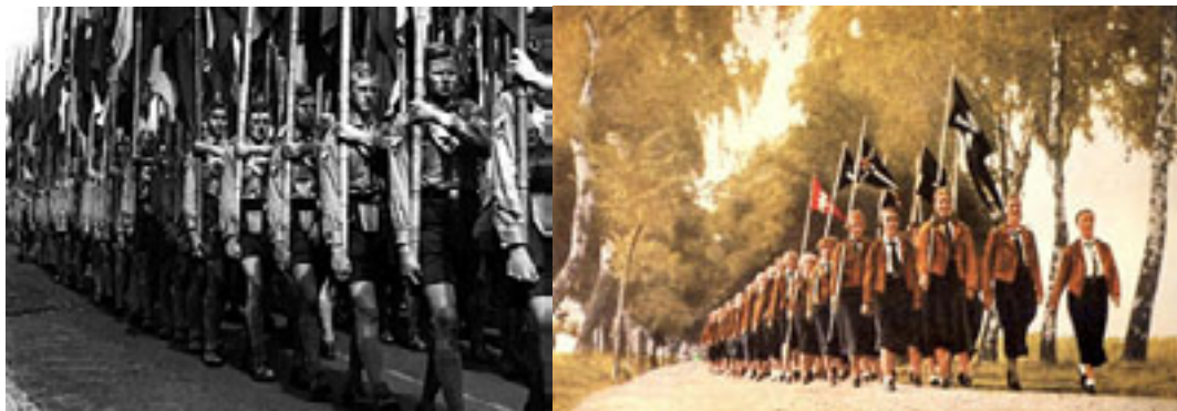
Marșuri, steaguri, uniforme – înregimentarea tinerilor în Germania Nazistă

În Reich-ul nazist înregimentarea tinerilor este un obiectiv fundamental al noului regim. Partidul supraveghează atent educația desfășurată în cadrul familiei, în școală sau în organizațiile naziste. De la vârsta de 8 ani copiii sunt înregimentați în Jungvolk iar adolescenții devin membrii ai Tineretului Hitlerist (Hitlerjugend – organizație devenită obligatorie din 1936) unde în afara învățământului ideologic aceștia sunt pregătiți să devină soldați loiali ai Reich-ului. Fetele primesc o educație diferită în școli și organizații speciale de genul Ligii tinerelor germane, destinate pregătirii pentru a corespunde modelului celor trei "K" (Kinder, Kirche, Küche – copii, biserică, bucătărie).