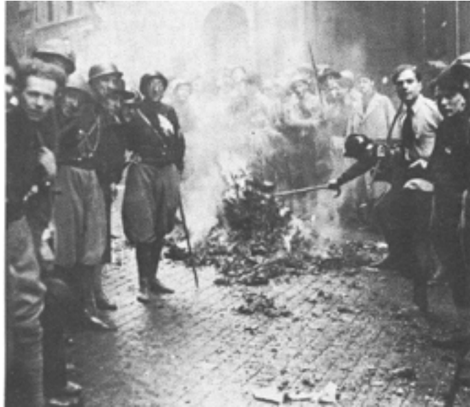
Arderea cărților "periculoase" pentru ideologia fascistă

Presa, radioul, cinematografia sunt supuse unei cenzuri stricte, iar administrația, armata și învățământul sunt epurate de adversarii regimului.