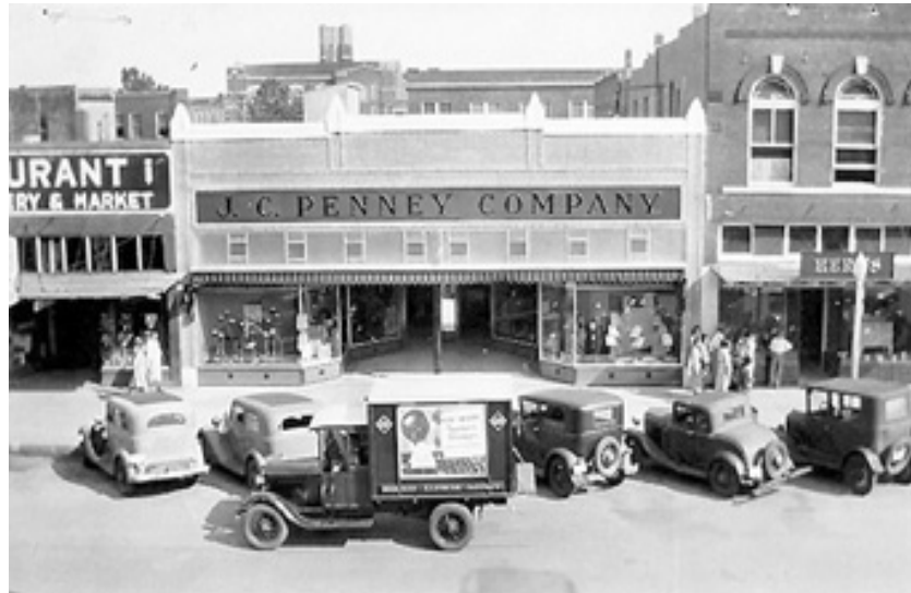
Durant, Oklahoma – Centrul orașului – Filiala lanțului de magazine JCPenney