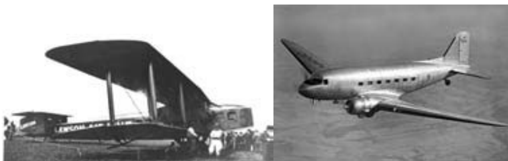
Lawson C-2, unul dintre primele aparate de zbor comerciale din perioada interbelică (stânga), DC-3, avion comercial la sfârșitul anilor 30.

Anii 20 înseamnă și accelerarea progreselor tehnice, perfecționarea și integrarea unor invenții până atunci experimentale și generalizarea electricității și a motorului cu explozie internă. Domeniul energetic se dezvoltă, producția de electricitate se dublează și cantitatea de energie pe cap de locuitor crește cu 20%. Tot acum se înregistrează demarajul transportului aviatic care trece de la 50.000 pasageri în 1928 la 173.000 în 1929.