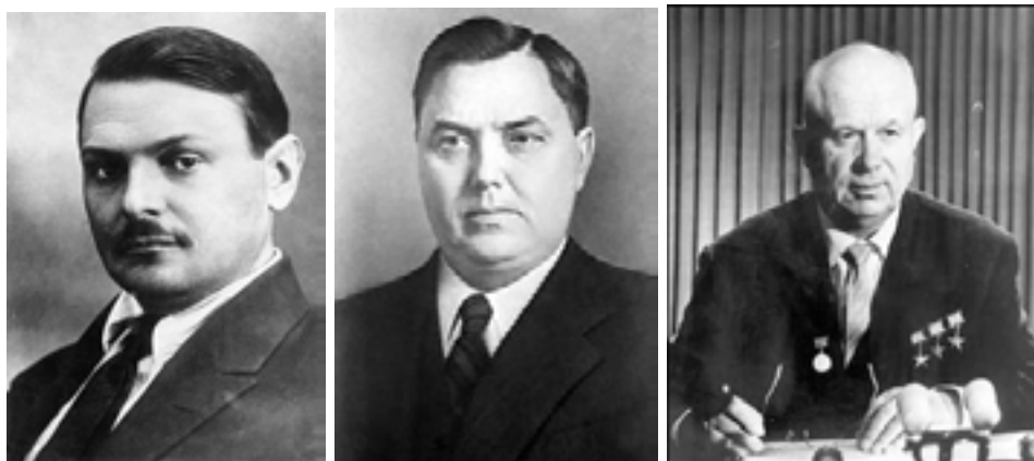
Competitorii pentru succesiunea lui Stalin: A.Jdanov, G. Malenkov, N.Hrușciov

În ciuda declinului fizic și a neîncrederii patologice în cei din jur, poziția lui Stalin de centru necontestat al puterii a fost favorizată și de conflictele dintre personajele principale ale conducerii comuniste. Cea mai notabilă este opoziția dintre Malenkov și Jdanov în care liderul sovietic și-a păstrat neutralitatea numai în aparență, în realitate subminându-le amândouă pozițiile. De altfel, Stalin a tolerat asemenea conflicte numai pentru a-i putea slăbi pe „combatanți”. Lupta pentru succesiunea lui Stalin s-a declanșat încă din timpul vieții acestuia, acesta profitând de ea pentru a-și înlătura adversarii politici. Moartea lui Andrei Jdanov în 1948 a părut să-l propulseze pe Gheorghii Malenkov în postura de succesor probabil și Stalin a sprijinit campania acestuia de înlăturare a foștilor susținători ai lui Jdanov. În același timp, însă, Stalin începe să cultive un alt personaj, pe Nikita Hrușciov.