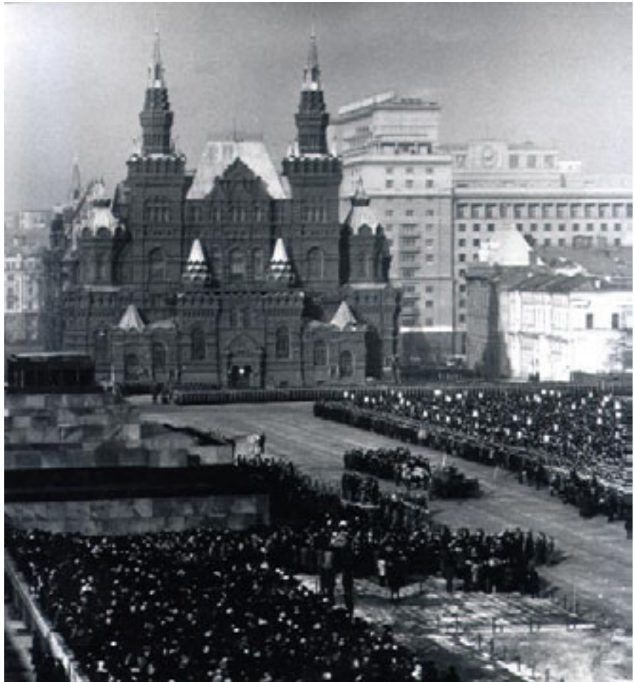
Funeraliile lui Leonid Brezhnev – parte a „cultului conducătorului”

Succesorul său imediat a fost Iuri Andropov și alegerea sa reprezenta în parte recunoașterea nevoii de schimbare. În calitate de fost șef al KGB, Andropov cunoștea foarte bine realitatea sovietică, iar instituția din care provenea, foarte bine informată și în permanent contact cu lumea occidentală, devenise unul din centrele de putere favorabile schimbării.