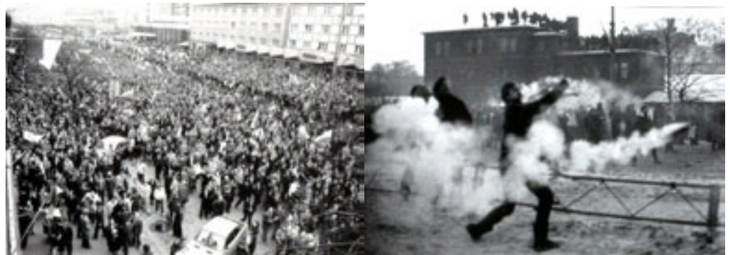
Manifestație a sindicatului liber Solidaritatea și înfruntări cu forțele de ordine.

Începută tot în portul Gdansk, la șantierele Lenin, mișcarea de protest a dobândit rapid dimensiuni naționale și s-a transformat în primul sindicat liber din lagărul comunist - „Solidaritatea”, condus de Lech Walesa. Autoritățile au fost nevoite în final să negocieze cu noul sindicat, oferindu-i astfel recunoaștere.