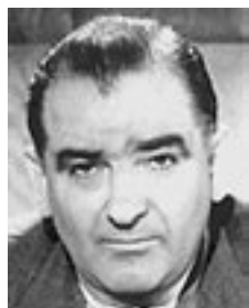
Sen. J. McCarthy

Mai mult decât atât, fostul comandant al trupelor aliate din Europa, generalul Dwight D. Eisenhower, se hotărăște să candideze din partea Partidului Republican (în 1948 democrații fuseseră cei care încercaseră să-l desemneze drept candidat al propriului partid). De data aceasta, șansele unei răsturnări de situație similare celei din 1948 erau nule.