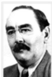
Imre Nagy 1896-1958

campaniilor represive inițiate de Rakosi.