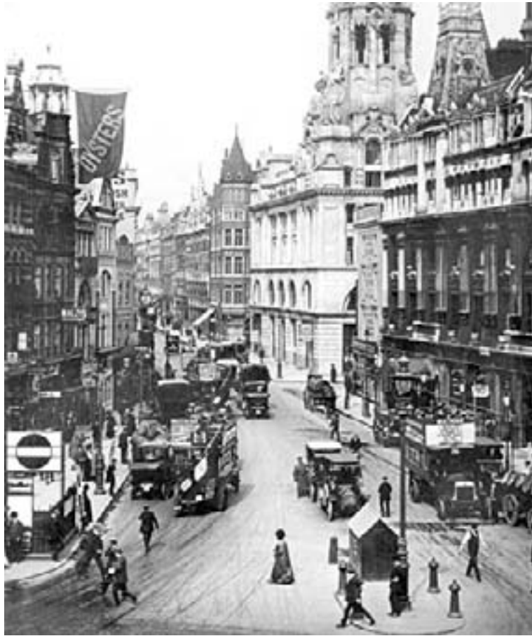
Londra în anii 20