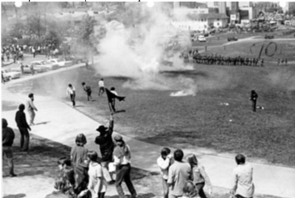
Mai 1970 – demontații anti-război la Kent State University și intervenția Gărzii Naționale soldate cu 4 victime.

Prelungirea conflictului din Vietnam a afectat Partidul Democrat, dar identificarea sa cu cauza drepturilor civile i-a dăunat și mai mult în plan politic, în special în Sud. Chiar dacă și-au menținut majoritatea în Congres, democrații au fost incapabili să recâștige Casa Albă, republicanul Richard Nixon câștigând la o diferență de numai 500000 de voturi. Mandatul noii administrații a debutat pe fondul continuării agitațiilor studentești. Protestele anti-război au escaladat pe parcursul lui 1969 și 1970, culminând cu evenimentele de la Kent State University, unde patru studenți au fost uciși.