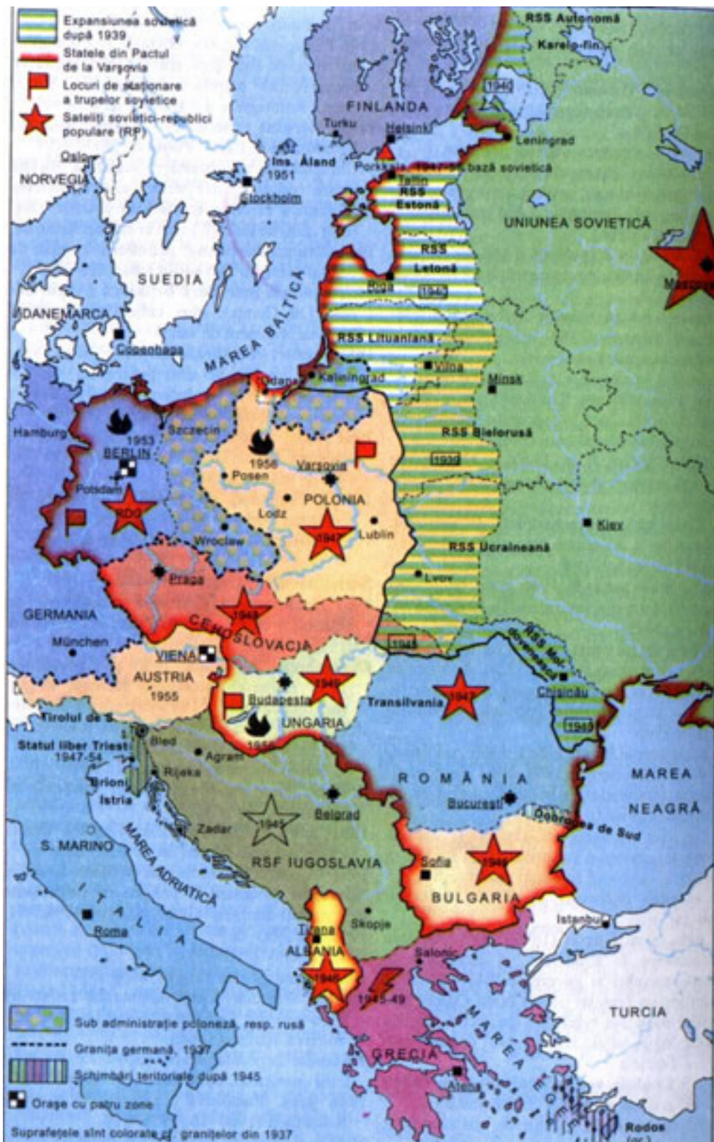
Sistemul sateliților sovietici în Europa de Est după al doilea Război Mondial, Atlas de Istorie Mondială, v.II, RAO, București, 2003, pg. 508.