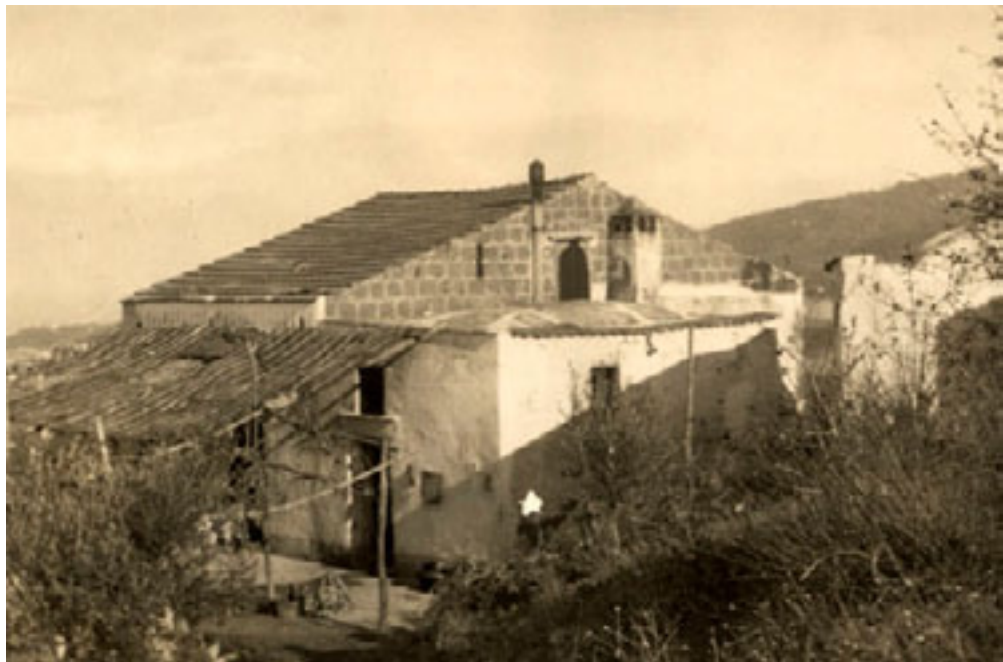
Casă țărănească din sudul Italiei

Agricultura Artizanatul tradițional și agricultura rămân domeniile ce grupează peste 55% din populația activă a Italiei, în condițiile în care 9/10 dintre proprietarii funciari posedau un teren absolut insuficient, sub 3 acri. Agricultura este inegal dezvoltată nereușind să asigure o aprovizionare regulată a țării. Piemontul, Lombardia, Toscana și câmpiile Padului sunt zone de excelență agricolă, dar marea problemă rămâne sudul Italiei (Mezzogiorno). Aici pământul se află în proprietatea marilor proprietari funciari neinteresați în investiții masive. Subindustrializată și suprapopulată, cu resurse naturale mediocre, retardată economic și neinteresantă pentru mediile de afaceri din Nord, această regiune alimentează șomajul cronic și emigrația masivă spre Franța, America Latină și Statele Unite.