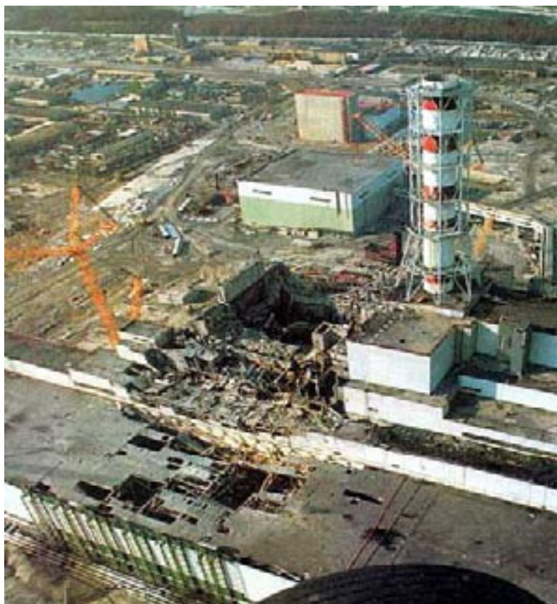
Explozia produsă la centrala atomică de la Cernobil în 1986 a condus la decesul datorat iradierii a peste 100.000 de persoane și a costat statul sovietic aproape 13 miliarde de dolari.