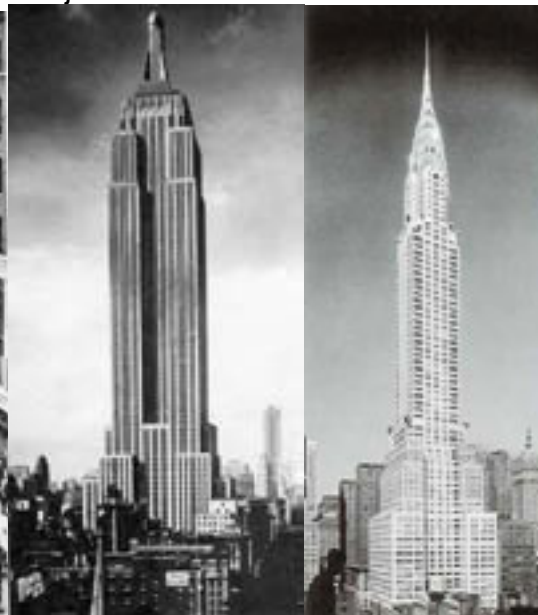
Empire State Building Chrysler Building

Orașele mici și mijlocii altădată somnolente se integrează în viața activă, atrag sucursalele marilor firme, ale băncilor, ale societăților de credit iar imaginea lor este tot mai asemănătoare datorită civilizației automobilului (garaje, parcări, benzinării, piețe de ocazie, autostrăzi).