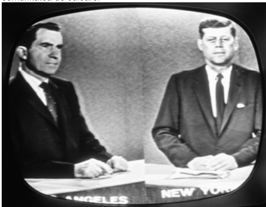
Prima dezbateră electorală televizată – 1960

partener din sud, Lyndon B. Johnson, care să-i asigure votul majorității statelor sudice, dar în același timp a încercat să atragă de partea sa comunitatea de culoare.