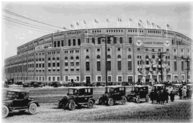
Deschiderea stadionului Yankee Stadium – New York, 1923

Petrecerea timpului liber și organizarea acestuia era o preocupare constantă pentru americanul mijlociu - turism, meciuri de box, de fotbal american, de baseball, cluburi de dans (jazz, charlestone), iar revistele reprezentau pentru majoritatea americanilor singura lectură cotidiană, în condițiile unei prese absolut libere în fața actorilor politici dar în mare parte dependentă de marile medii de afaceri (magnatul W. Hearst controla 40 de publicații).