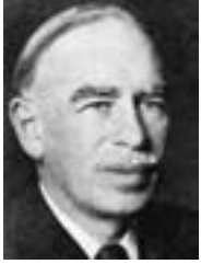
John M. Keynes 1883-1946

economie în care proprietatea de stat coexistă cu cea privată și statul își asumă un rol proeminent în economie.