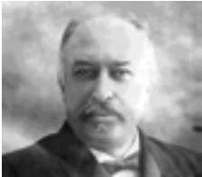
Giovanni Giolitti 1842-1928