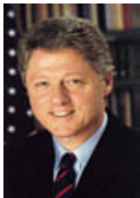
William J. Clinton