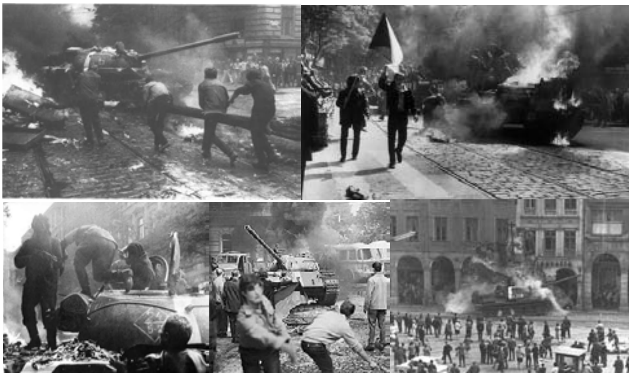
Lupte de stradă în Praga împotriva intervenției armate a Pactului de la Varșovia în 1968 iar în ultima imagine – demonstrație de forță a unui tanc sovietic în Liberec.

În cele din urmă, trupele Pactului de la Varșovia au invadat Cehoslovacia în noaptea lui 20 august 1968, punând astfel capăt „Primăverii de la Praga”. Unul din obiective era împiedicarea reunirii Congresului prevăzut pentru luna septembrie unde reprezentanții aveau să fie aleși în mod liber dintre membrii partidului și care trebuia să pună în practică Programul de acțiune din aprilie.