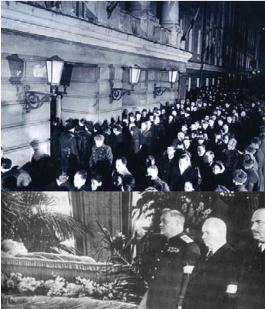
Funeraliile lui Stalin: (sus) muncitori moscoviți la catafalcul lui Stalin de la Casa Sindicatelor, (jos) garda de onoare a conducătorilor sovietici - Bulganin, Hrușciiov, Kaganovici. Stalin a fost depus, mumificat, în mausoleul dedicat lui Lenin, dar în 1961 Hrușciiov a ordonat mutarea corpului lui Stalin într-un mormânt mult mai modest.

Regimul a inițiat sub conducerea lui Jdanov un adevărat război cultural împotriva inovației, a modernismului, a liberalismului și a tot ce este occidental. Literatura și muzica în special erau văzute ca instrumente esențiale pentru unirea poporului în spatele idealurilor bolșevice. Nici știința nu a scăpat de amestecul ideologicului, cel mai bun exemplu fiind cel al biologiei. Această ofensivă era menită în bună măsură să disciplineze intelectualitatea, însă rezultatul a fost izolarea Uniunii Sovietice de evoluțiile intelectuale din exterior.