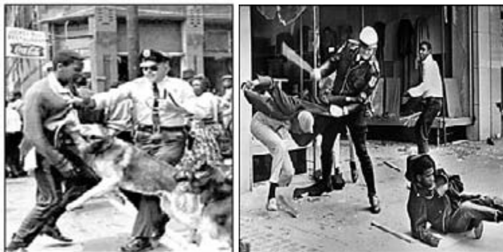
Revoltele rasiale din anii '60 au afectat majoritatea orașelor mari din Statele Unite.

crearea Medicare, un program de asistență medicală pentru bătrâni, finanțarea de către autoritățile federale a învățământului primar și gimnazial și Voting Rights Act care autoriza procurorul general să supervizeze înregistrarea pentru vot a persoanelor ce aparțineau minorităților. Activitatea sa legislativă a fost cu adevărat impresionantă în acest al doilea mandat al său: de la măsuri de protecție a mediului și liberalizarea legilor privind imigrația la crearea Departamentului Transportului și la interzicerea discriminării rasiale în vânzarea și închirierea locuințelor.