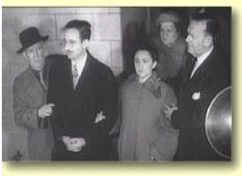
Arestarea lui Julius și Ethel Rosenberg acuzați și ulterior judecați și executați pentru spionaj în favoarea Uniunii Sovietice

inacceptabile chiar și pentru o mare parte a susținătorilor săi în 1954, în momentul în care atenția senatorului s-a îndreptat spre „promovarea comuniștilor” de către armata americană.