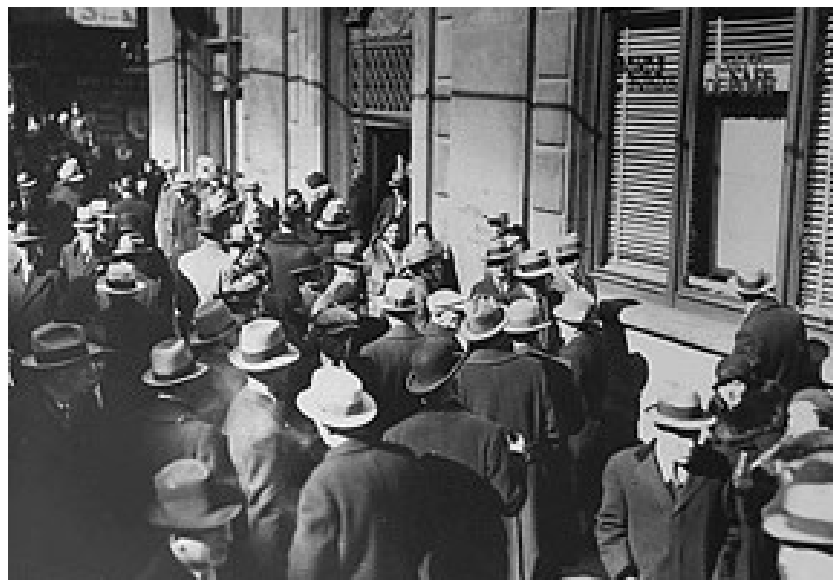
Panica bancară - 1930

Președintele Hoover, atașat de individualismul și liberalismul clasic, a refuzat însă intervenția directă a guvernului federal în domeniul economic și a recurs la paliativele clasice - politică deflaționistă, stocare, susținerea întreprinderilor aflate în dificultate. Federal Reserve Bank a aruncat încă 300 mil.$ pe piața creditelor pentru a susține consumul și au fost menținute salariile mari și taxele mici. Aceste măsuri au agravat însă criza întrerupând temporar falimentele și împiedicând băncile să se salveze. Anul 1930 va aduce și prima panică bancară (a doua în primăvara lui 1931 și o a treia în martie 1933), panică ce se soldează cu masive retrageri de fonduri și cu falimente în lanț. Produsul național brut a scăzut cu 9,4%, iar șomajul a crescut de la 3,2 la 8,7%.